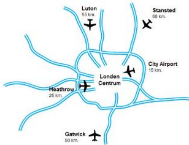
Ligging van de luchthavens in Londen

De naam zegt het al. London City Airport ligt praktisch in de stad. Vanuit dit kleinschalige airport ben je dan ook snel in het centrum van Londen. Voor zakenreizigers die in The City of Canary Wharf moeten zijn is dit vliegveld ideaal. Dankzij de ligging maar ook vanwege de korte inchecktijden ontdekken steeds meer toeristen London City Airport. De tarieven van de vliegmaatschappijen die op City Airport vliegen zijn zeer concurrerend. Vanuit Nederland vliegt CityJet direct naar dit vliegveld. Vertrekken kan inmiddels vanaf Eindhoven, Rotterdam en Amsterdam. London City Airport heeft een klein tax free shopping gedeelte maar lang hoeft u niet door te brengen op dit vliegveld. Inchecken voor je vlucht kan tot 20 minuten voor vertrek (zonder bagage) en 30 minuten met bagage!